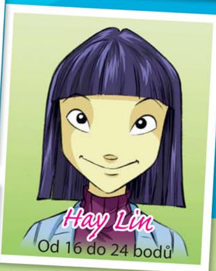
Hay Lin Od 16 do 24 bodů