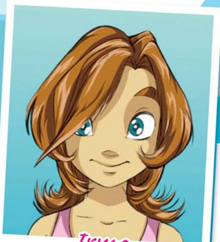
Irma Od 41 do 50 bodů

Rada: Svou přirozenou barvu oživiš několika světlejšími proužky.