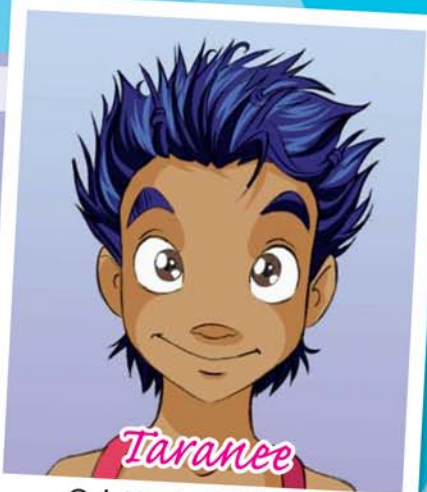
Taranee Od 10 do 15 bodů