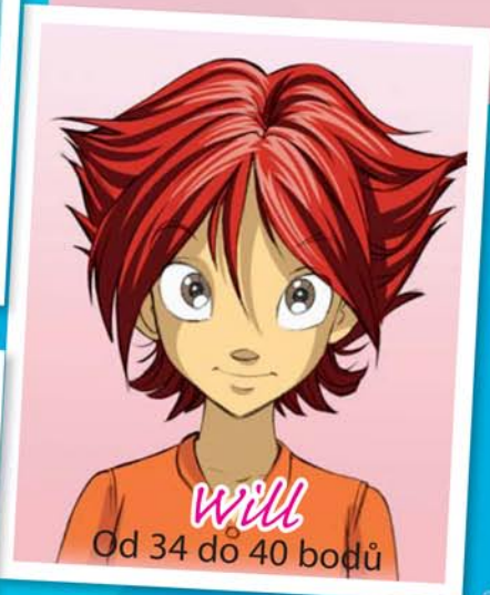
Will Od 34 do 40 bodů

Rada: Jestli máš chuť na změnu, svůj účes můžeš dotvarovat gelem.